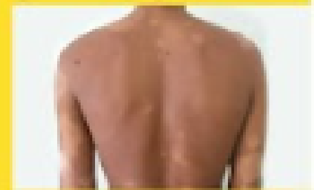
त्वचा पर हल्के रंग के धब्बे