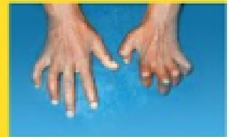
अंगों की संवेदनशीलता का कम होना

यदि आप इसमें से कोई भी लक्षण से ग्रसित हैं तो अपने नज़दीकी सर्परींग विशेषज्ञ या स्वास्थ्य केन्द्र पर तुरन्त सम्पर्क करें।