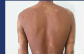
LIGHT PATCHES OR SPOTS ON SKIN