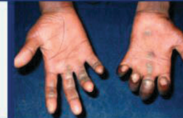
BENT FINGERS WITH ULCERS