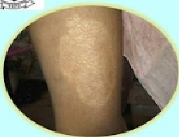
Light colored skin patch?