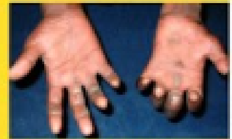
खालों के साथ उँगलियों का मुड़ना