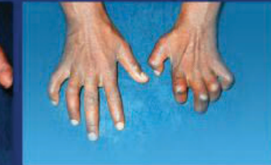
LOSS OF SENSATION