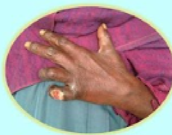
Bent fingers with non healing ulcers?